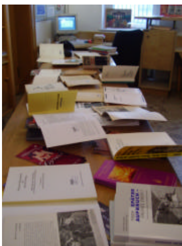
Meine Wirtschaft beim Sortieren der Bücher.

Spätestens bei dem Punkt 4 kam es zu Schwierigkeiten, da dieser von den Vorlieben des Bibliotheksleiters abhing. Welche von den Neuerscheinungen sollen hervorgehoben werden? Ab wann ist ein Buch eine Neuerscheinung? Wo genau sollten diese ausgestellt werden? So kam es, dass wir uns einigten, dass ich mich lieber wieder dem Computer widme und er die Bücher nach seinen Vorstellungen so wegstellt, dass sie auch wieder gefunden werden.