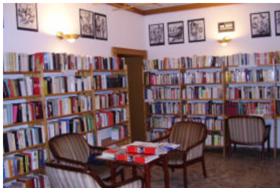
Belletristikbereich der Bibliothek.

Der Bestand der Spezialsammlung an Sach- und erzählender Literatur soll in erster Linie zur Aufklärung über die Ursachen und Folgen des Sowjetkommunismus als universeller Bedrohung der freiheitlich-demokratischen Welt dienen. Die Bibliothek umfasst inzwischen über 8.000 Werke - vor allem zur Sozialismusforschung, zur DDR-Geschichte mit Schwerpunkt Justiz und Staatssicherheit, Opposition und Widerstand, zur Geschichte der ehemaligen Sowjetunion und ihrem Repressionsapparat sowie der Verbrechen des Stalinismus/Kommunismus, Haft- und Lagererinnerungen (auch Manuskripte) als auch Literatur ehemaliger oppositioneller DDR-Schriftsteller und Dissidenten des Ostblocks.