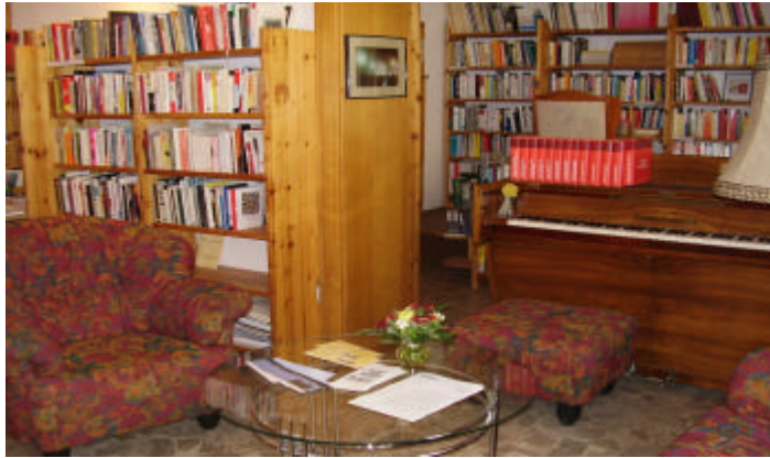
Hauptbibliotheksteil bei meiner Einordnung der Bücher in die Regale.

die Kategorie „Politik und Justiz in der SBZ/DDR“. Bei dieser Tätigkeit erfüllte sich nun mein Wunsch eine Reihe von Büchern kennen zu lernen, anzufassen, anzuschauen, diverse Titel zu lesen und meinen Horizont bezüglich des Bestandes zu diesem Thema zu erweitern.